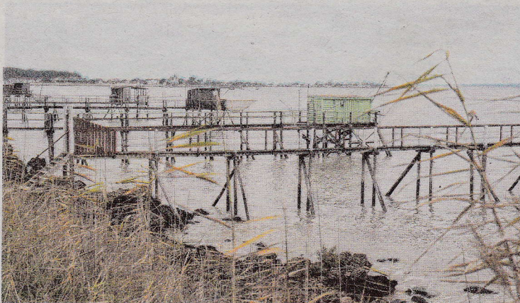
Le conseil de gestion du parc marin a émis un avis favorable à l'extension de la réserve d'Yves, entre La Rochelle et Rochefort. XAVIER LÉOTY

Les membres du conseil de gestion ont approuvé le futur chantier d'aménagement du port de Saint-Martin-de-Ré et l'extension de la réserve naturelle d'Yves